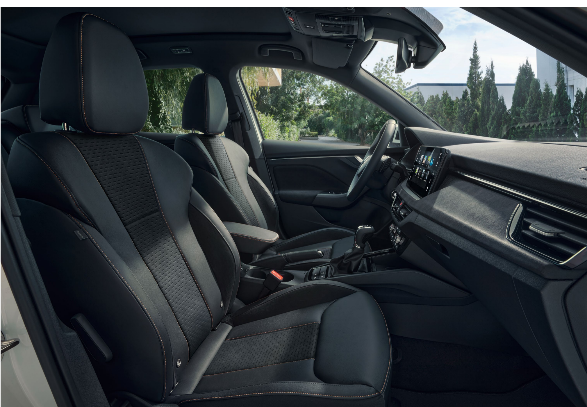
Interjeras „Monte Carlo“