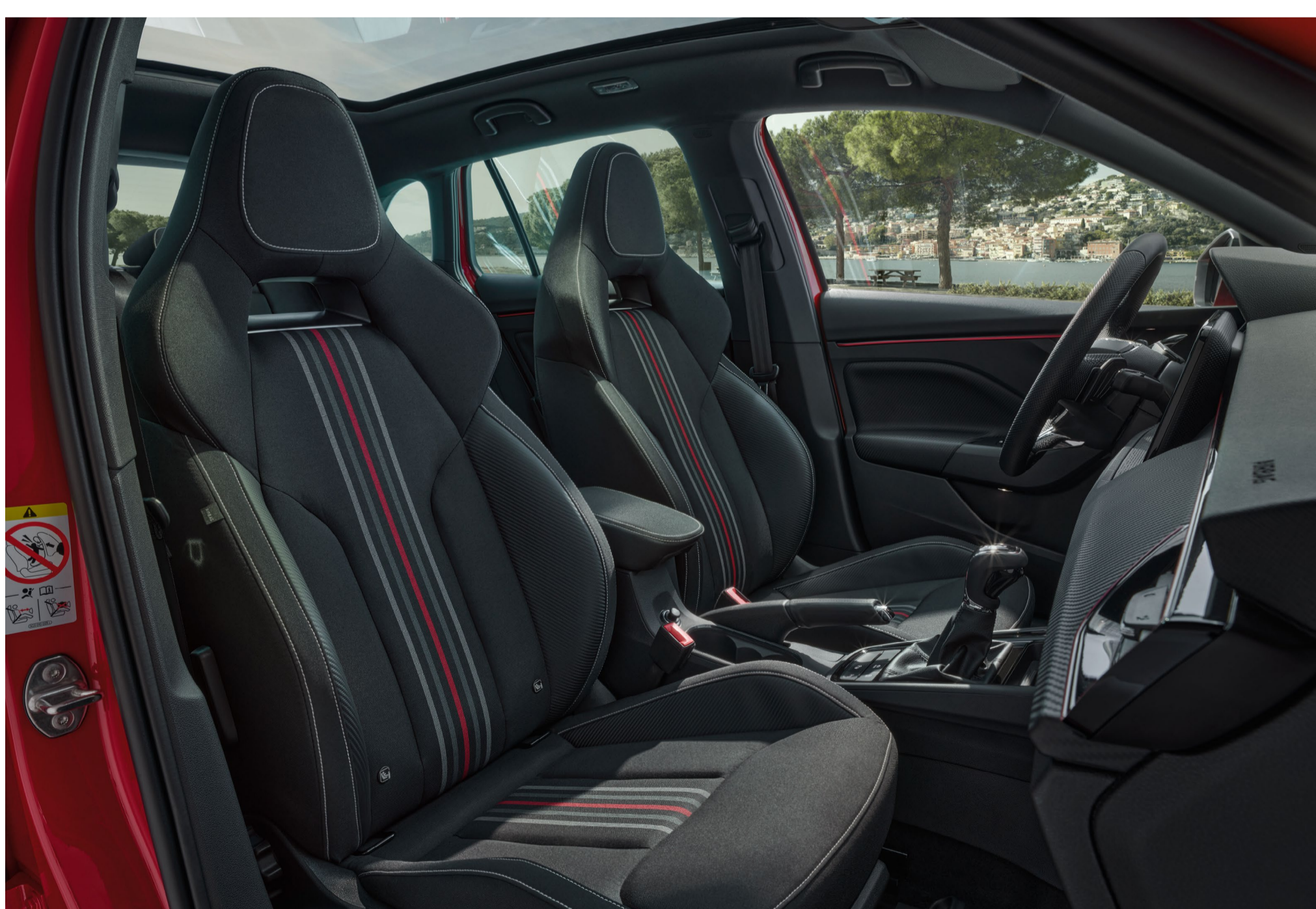
Interjeras „Monte Carlo“