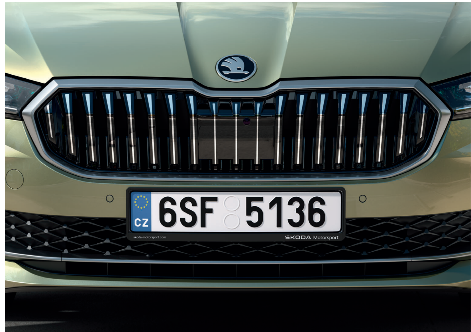
Valstybinio numerio rėmelis