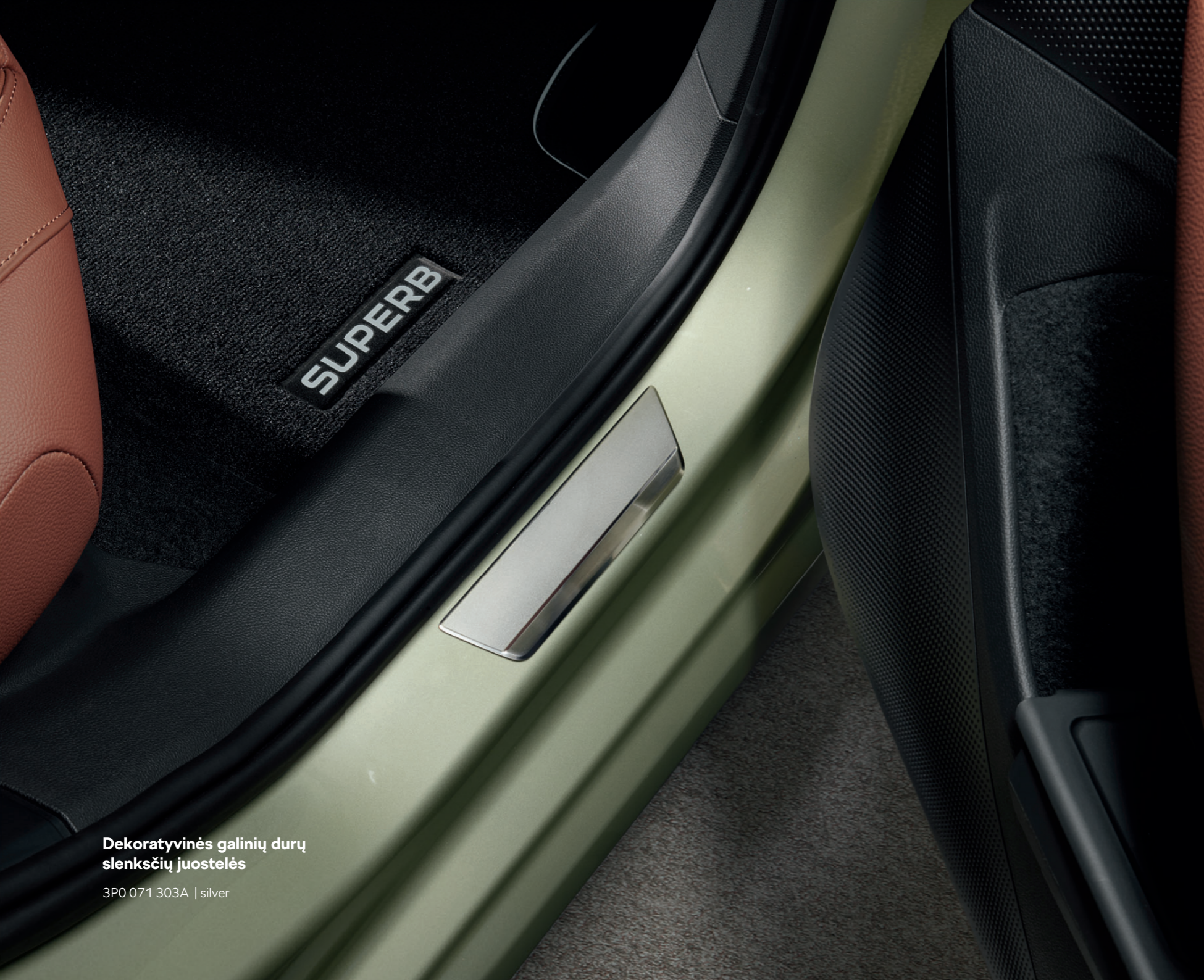
Dekoratyvines galiniu duru slenksčiu juostelės