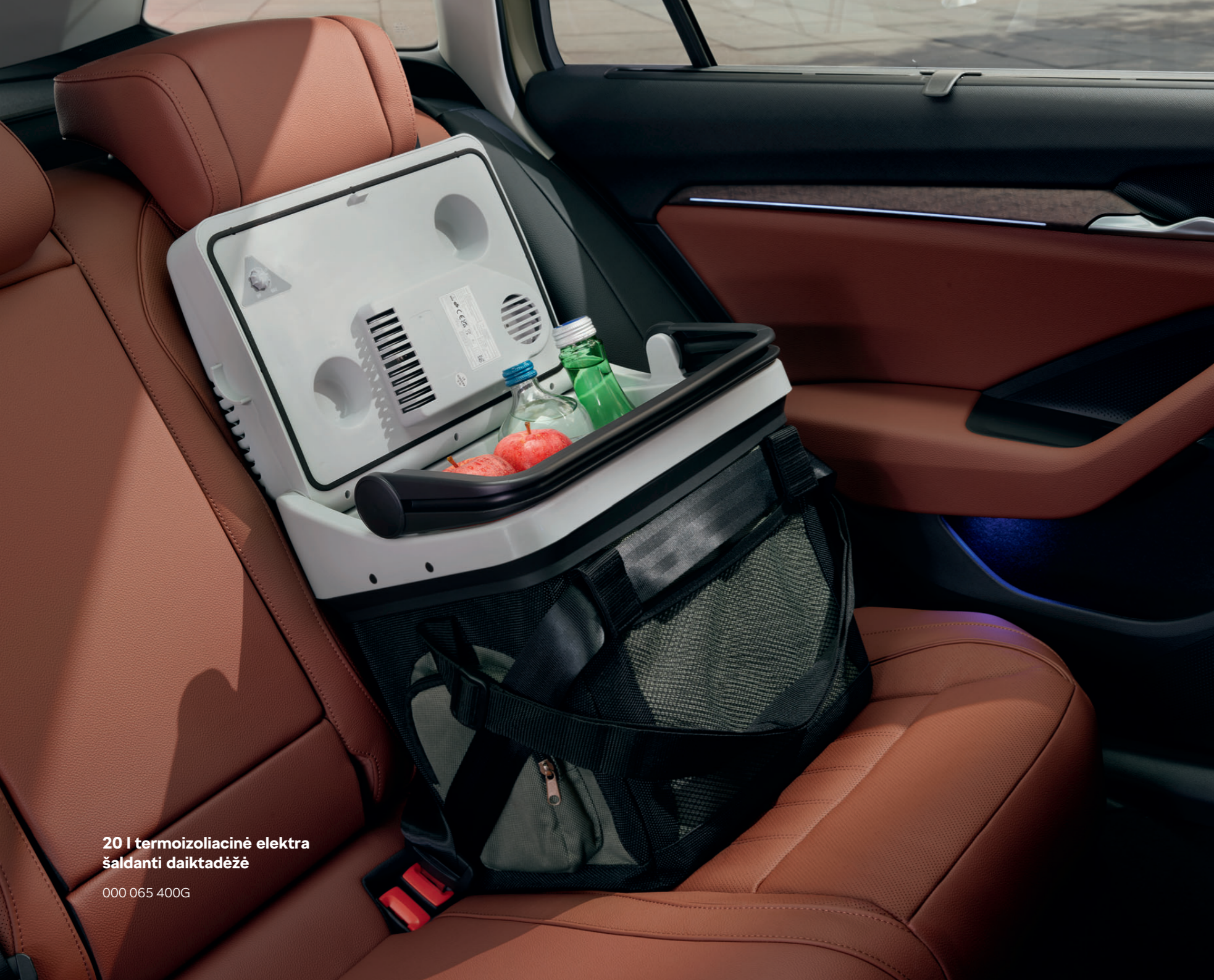
20 l termoizoliacinė elektra šaldanti daiktadėžė