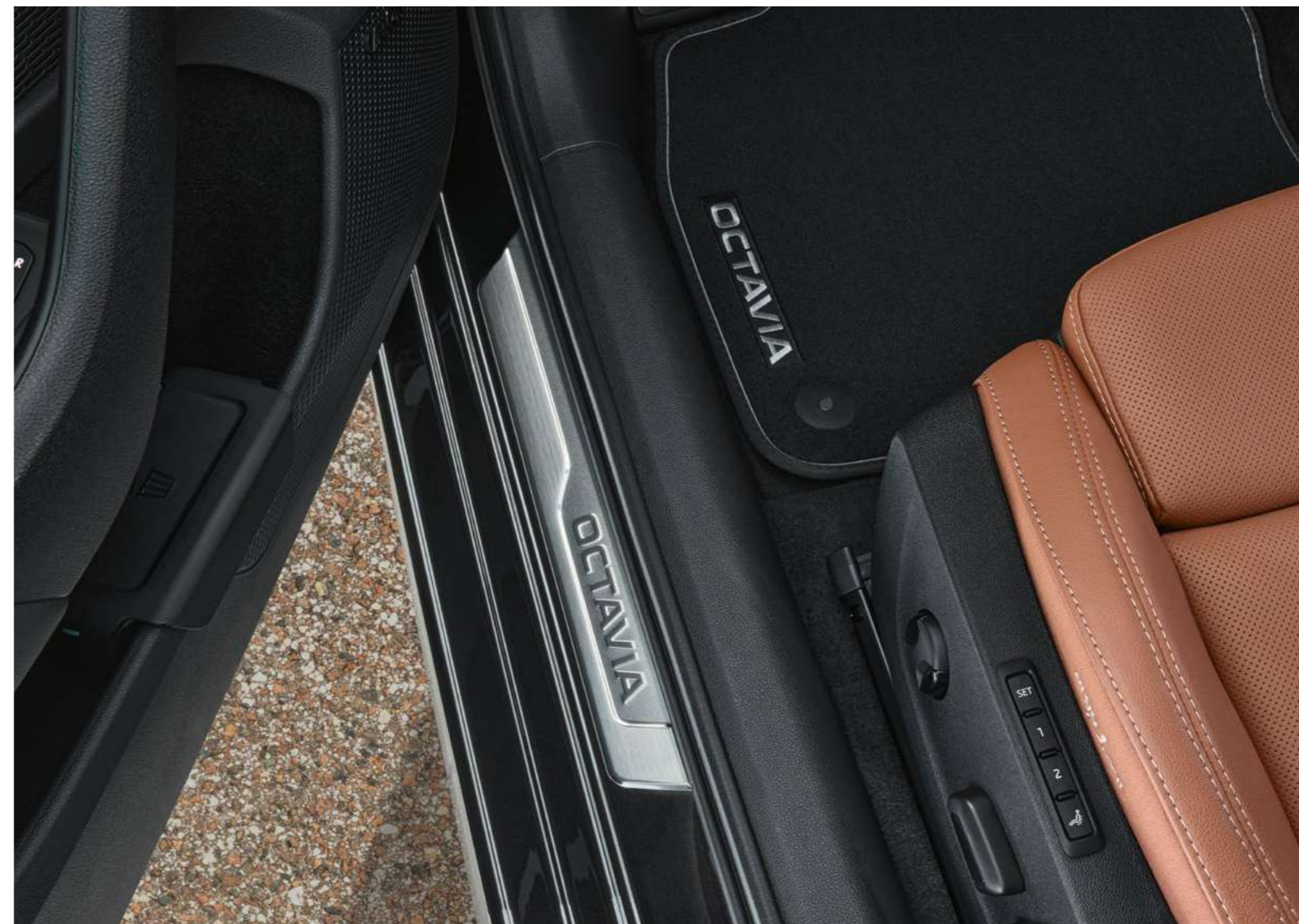
Dekoratyvines durų slenkščių juostelės - nerūdijantis plienas