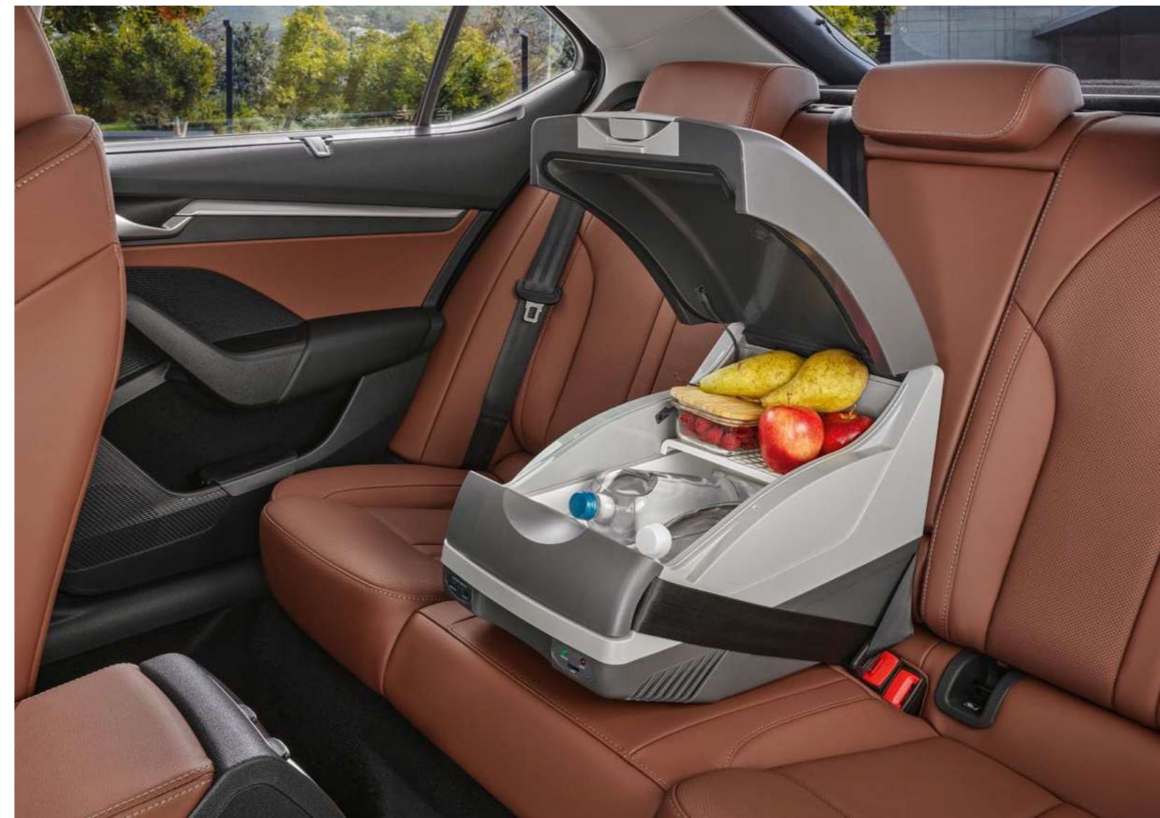
20 l termoizolacičné elektra šaldanti daiktadėžė