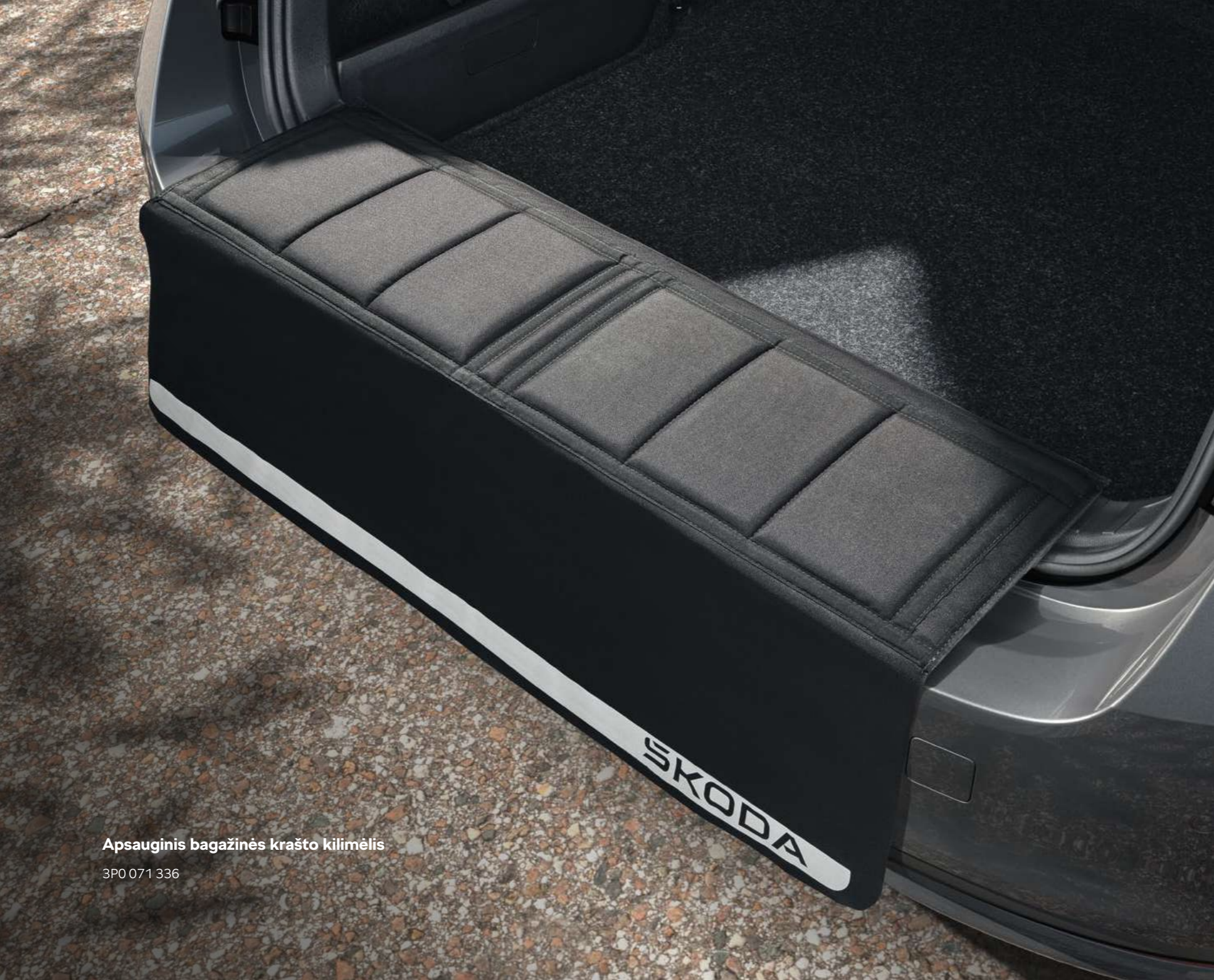
Apsauginis bagažinės krašto kilimėlis