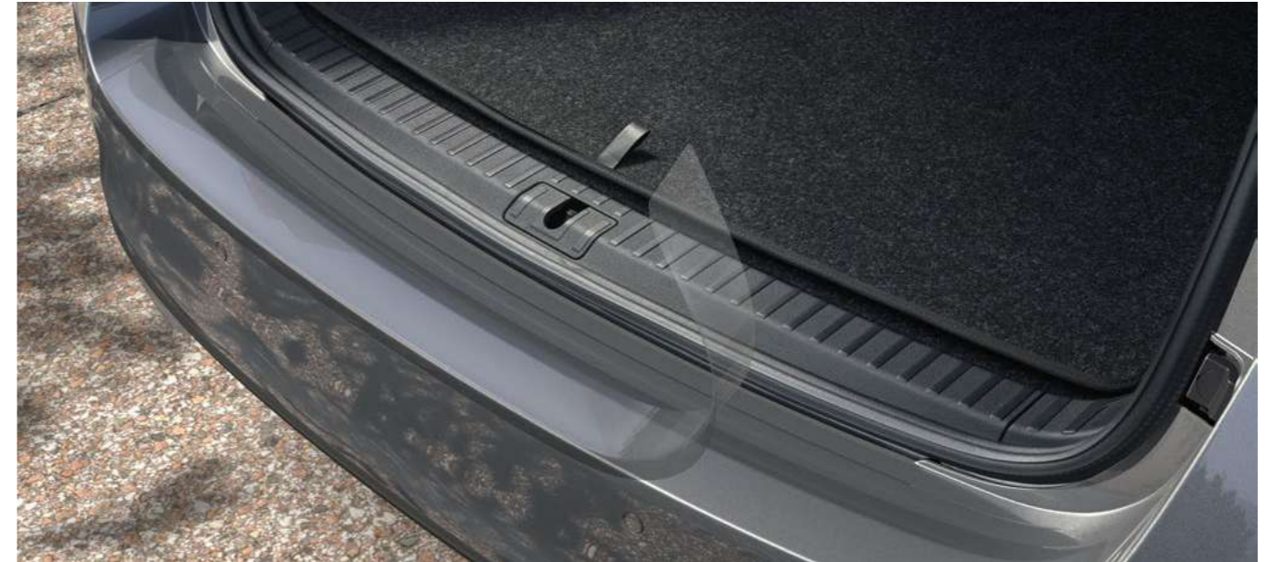
Apsauginė pakrovimo krašto plėvelė