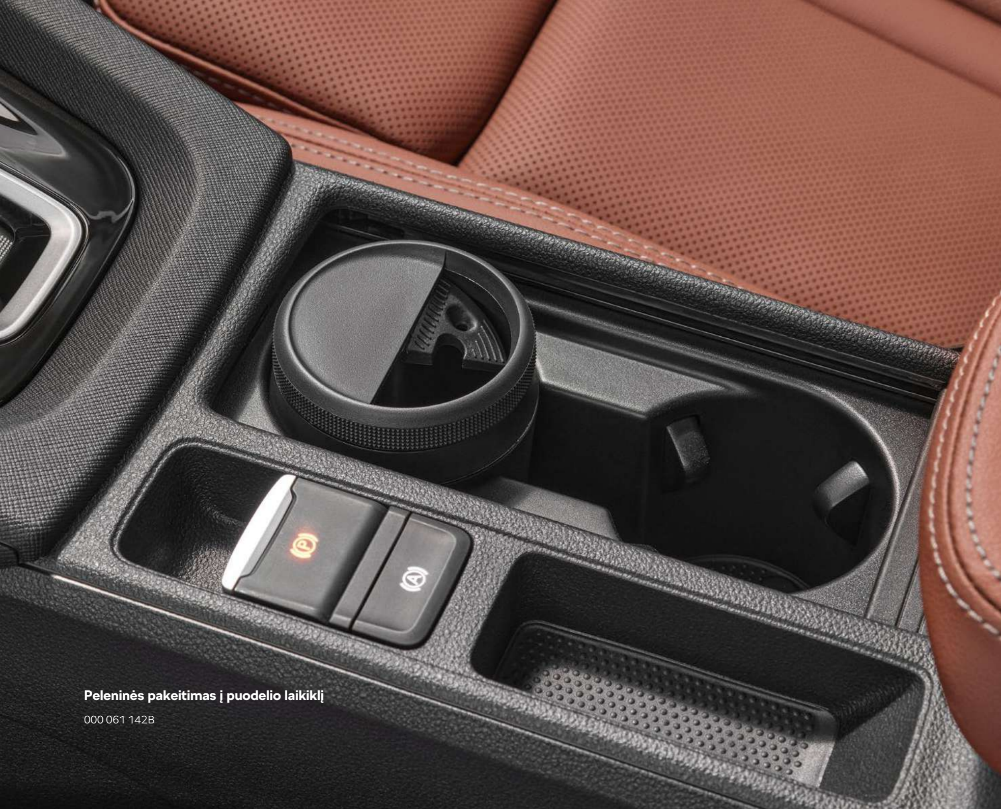
Peleninės pakeitimas į puodelio laikiklį