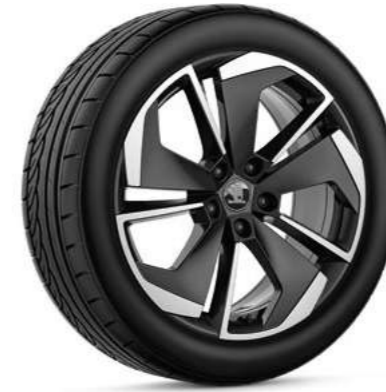
Comet lengvojo lydinio ratlankiai juodi metalizuoti, šlifuoti 7.5J × 18" ET48, skirti 225/45 R18 5E3 071 498 FL8 5E3 071 498AE FL8*