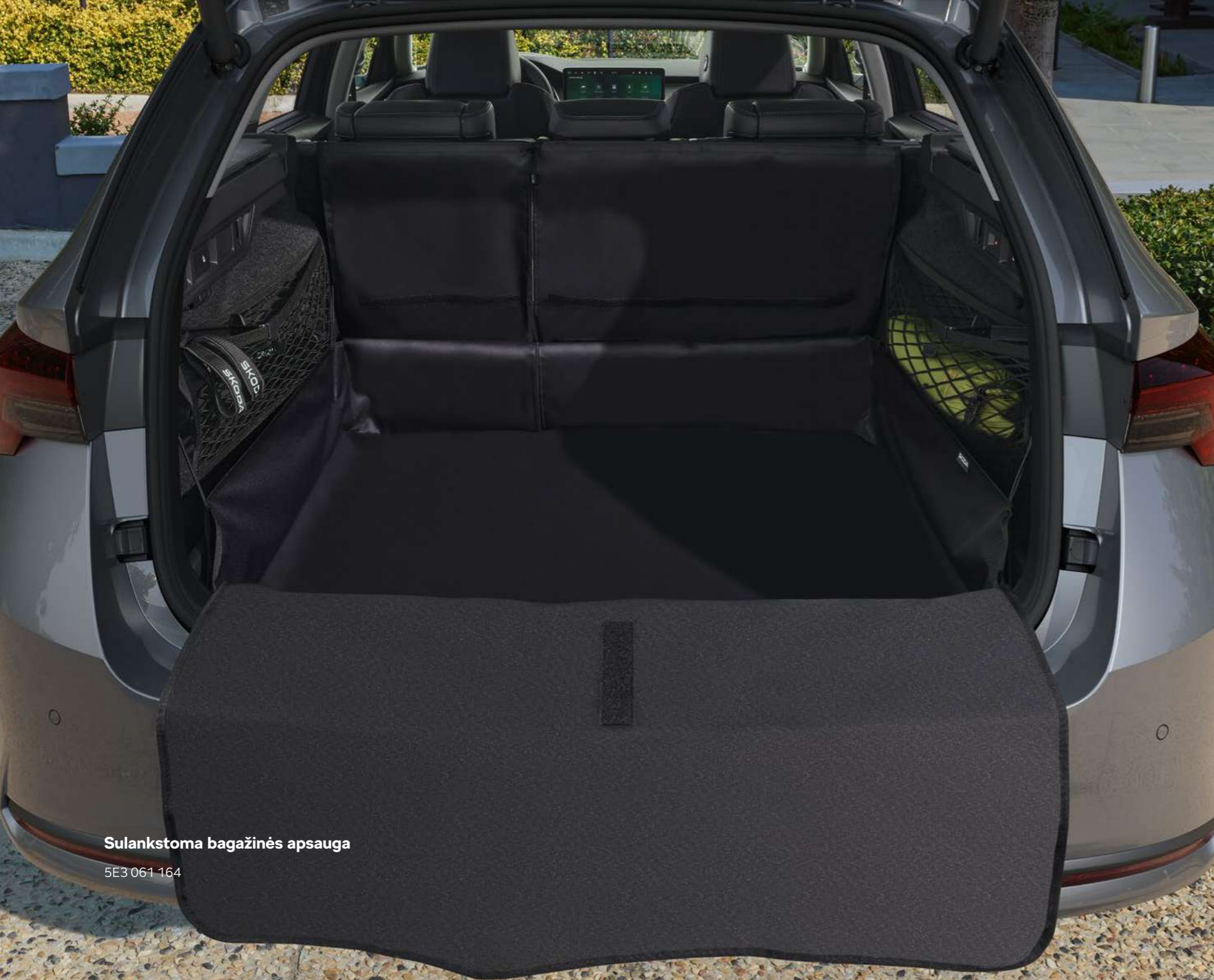
Sulankstoma bagažinės apsauga