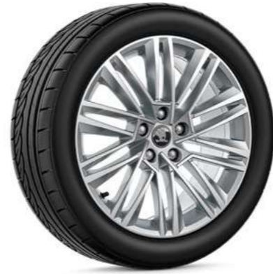
Luxon lengvojo lydinio ratlankiai sidabriniai metalizuoti, šlifuoti 7.5J × 18" ET48, skirti 225/45 R18 5E3 071 498B 8Z8 5E3 071 498AF 8Z8*