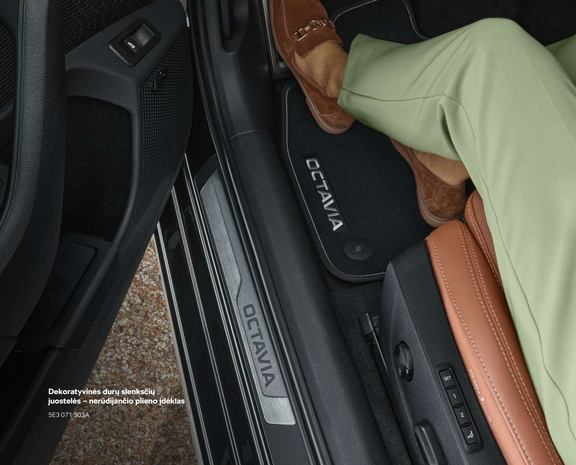
Dekoratyvines durų slenkščių juostelės – nerūdijančio plieno įdėklas