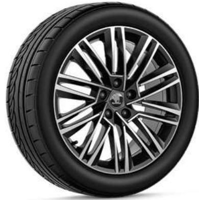
Luxon lengvojo lydinio ratlankiai juodi metalizuoti, šlifuoti 7.5J × 18" ET48, skirti 225/45 R18 5E3 071 498E FL8 5E3 071 498AG FL8*