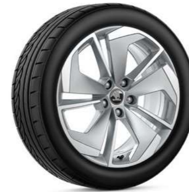
Comet lengvojo lydinio ratlankiai sidabriniai metalizuoti, šlifuoti 7.5J × 18" ET48, skirti 225/45 R18 5E3 071 498C 8Z8 5E3 071 498AJ 8Z8*