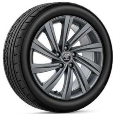
Perseus lengvojo lydinio ratlankiai antracito spalvos metalizuoti 7.5J × 18" ET48 for 225/45 R18 5E3 071 498P HA7 5E3 071 498AM HA7*