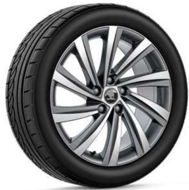
Perseus lengvojo lydinio ratlankiai antracito spalvos metalizuoti, šlifuoti 7.5J × 18" ET48, skirti 225/45 R18 5E3 071 498H HA7 5E3 071 498AL HA7*