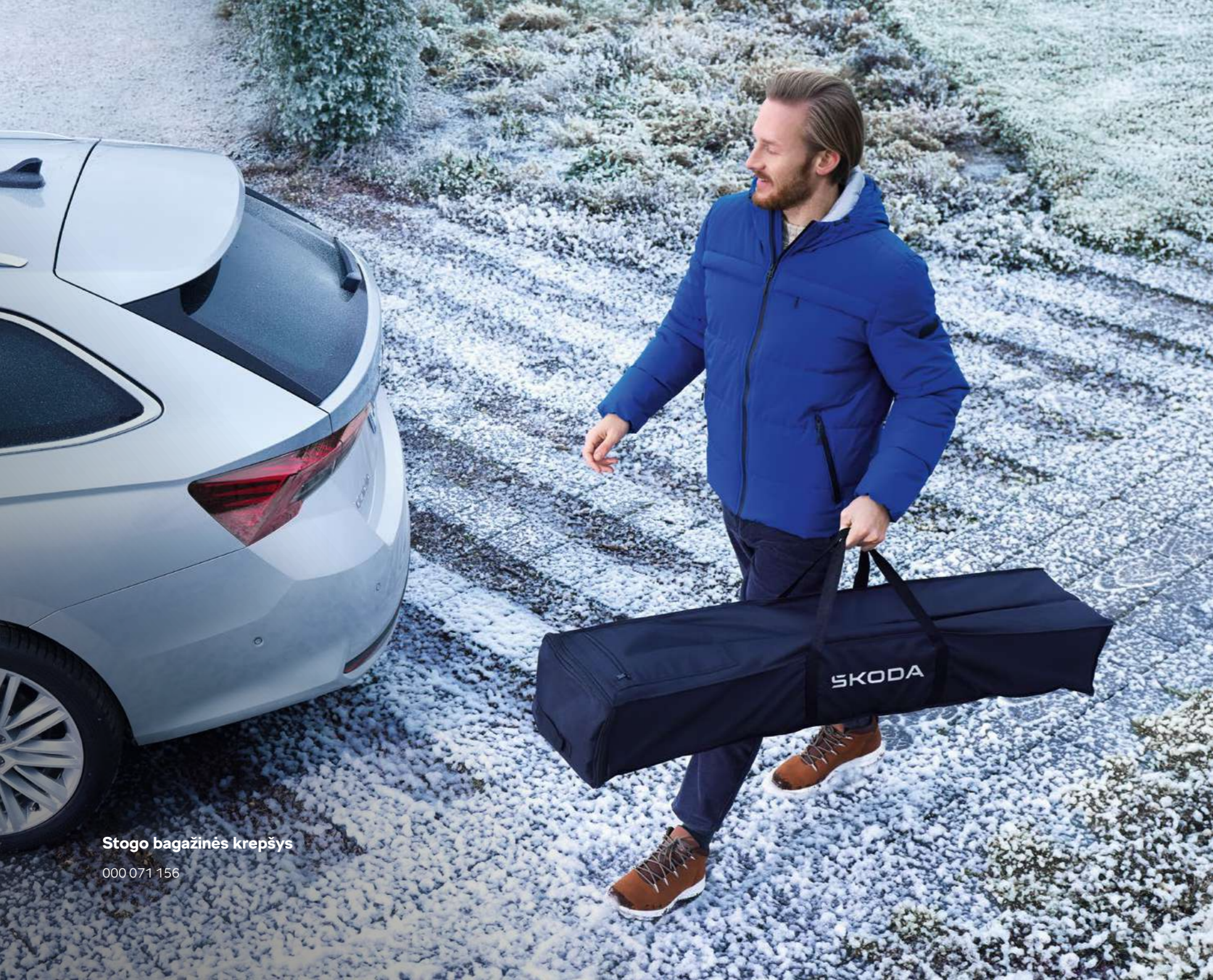
Stogo bagāžinēs krepšys