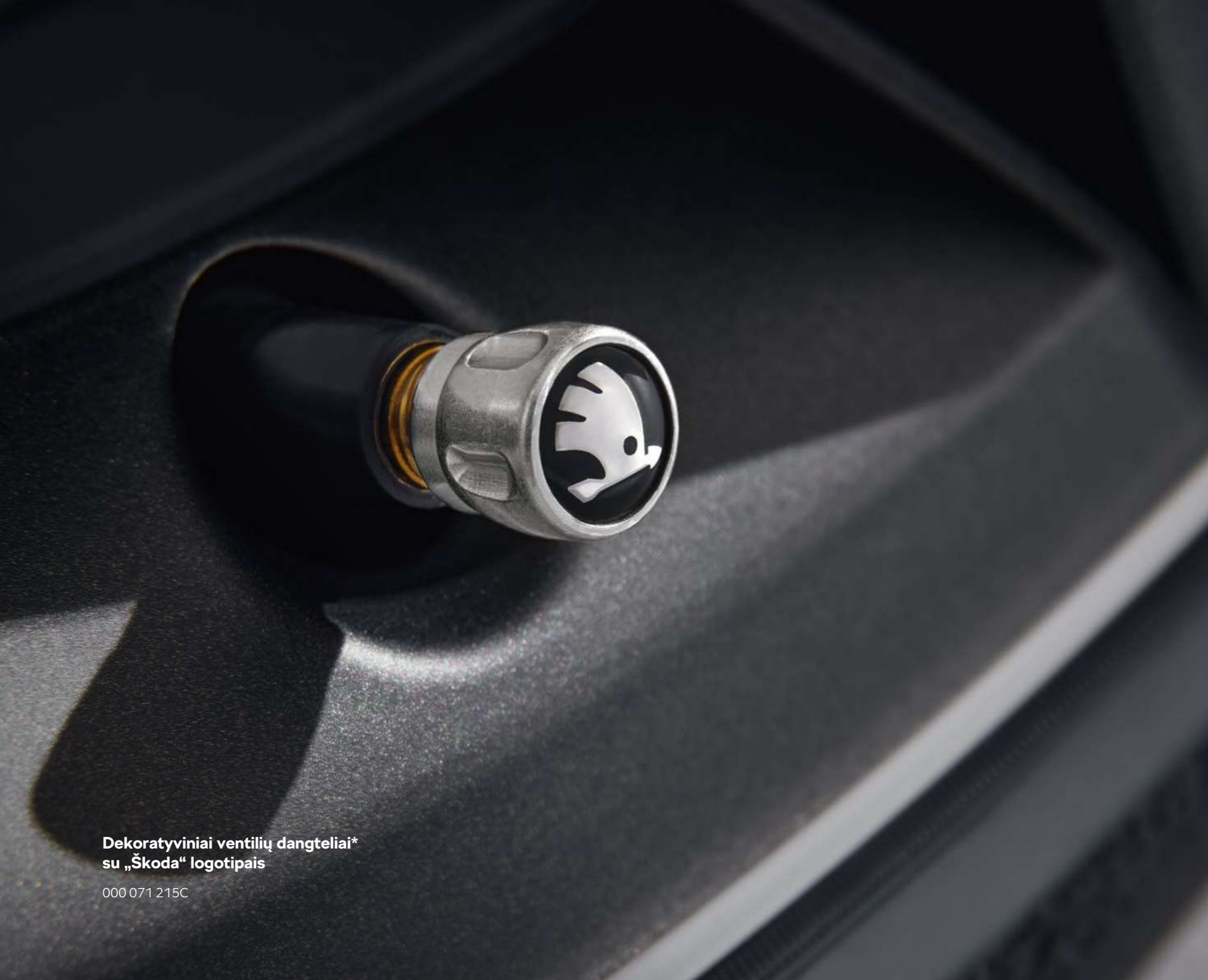
Dekoratyviniai ventilių dangteliai* su „Škoda“ logotipais