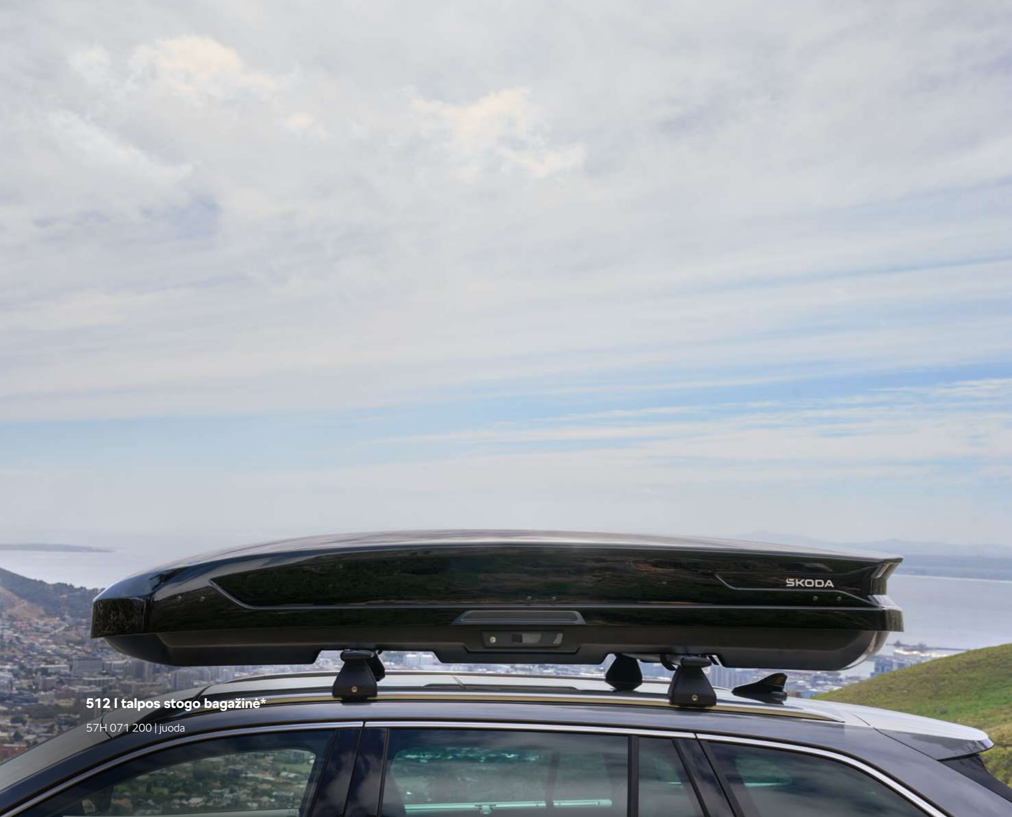
512 l talpos stogo bagažinė*