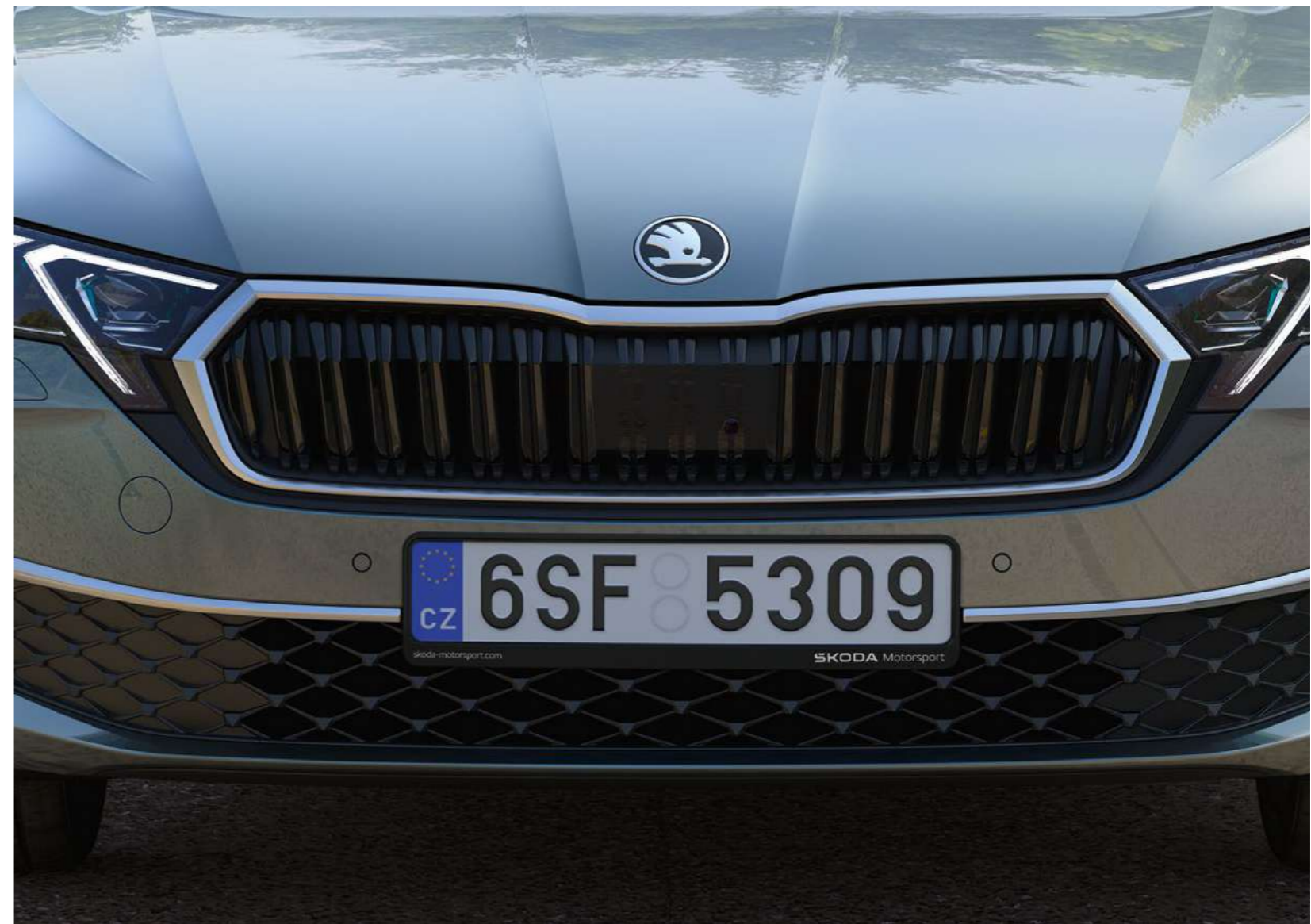
Valstybinio numerio rėmelis