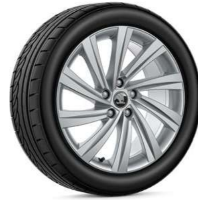
Perseus lengvojo lydinio ratlankiai sidabriniai metalizuoti 7.5J × 18" ET48, skirti 225/45 R18 5 E3 071 498N 8Z8 5E3 071 498AK 8Z8*