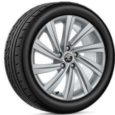
Perseus lengvojo lydinio ratlankiai sidabriniai metalizuoti, šlifuoti 7.5J × 18" ET48, skirti 225/45 R18 5E3 071 498G 8Z8 5E3 071 498AJ 8Z8*