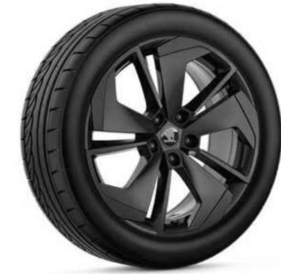
Comet lengvojo lydinio ratlankiai juodi metalizuoti 7.5J × 18" ET48, skirti 225/45 R18 5E3 071 498K FL8 5E3 071 498AF FL8*