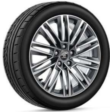
Luxon lengvojo lydinio ratlankiai antracito spalvos metalizuoti, šlifuoti 7.5J × 18" ET48, skirti 225/45 R18 5E3 071 498D HA7 5E3 071 498AH HA7*