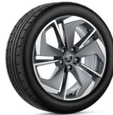
Comet lengvojo lydinio ratlankiai antracito spalvos metalizuoti, šlifuoti 7.5J × 18" ET48, skirti 225/45 R18 5E3 071 498A HA7 5E3 071 498AL HA7*