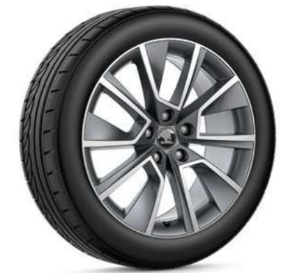
Braga lengvojo lydinio ratlankiai antracito spalvos, šlifuoti 7.5J × 18" ET48, skirti 225/45 R18 5E3 071 498M HA7 5E3 071 498AB HA7*